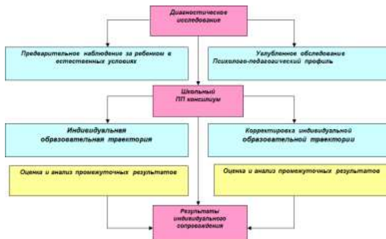
Рисунок 2. Схема взаимодействия педагогов и специалистов

Программа взаимодействия педагогов и специалистов реализуется через работу школьного психолого-педагогического консилиума (ППК). Программа предполагает осуществление комплексного многоаспектного анализа эмоционально-волевой, личностной, коммуникативной, двигательной и познавательной сфер учащихся с целью определения имеющихся проблем, разработки и реализации образовательной траектории и представлена на рисунке 2